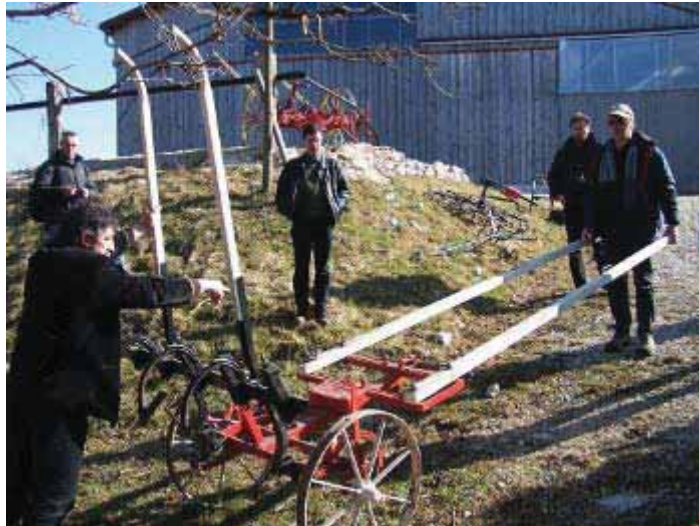
Griffes pour le maraichage. Machine Suisse