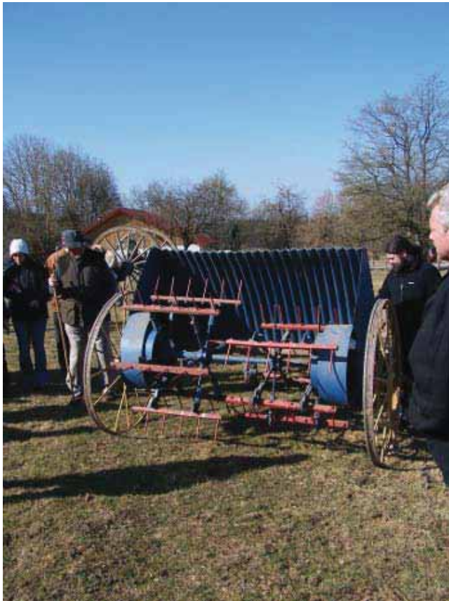
Semoire et faneuse