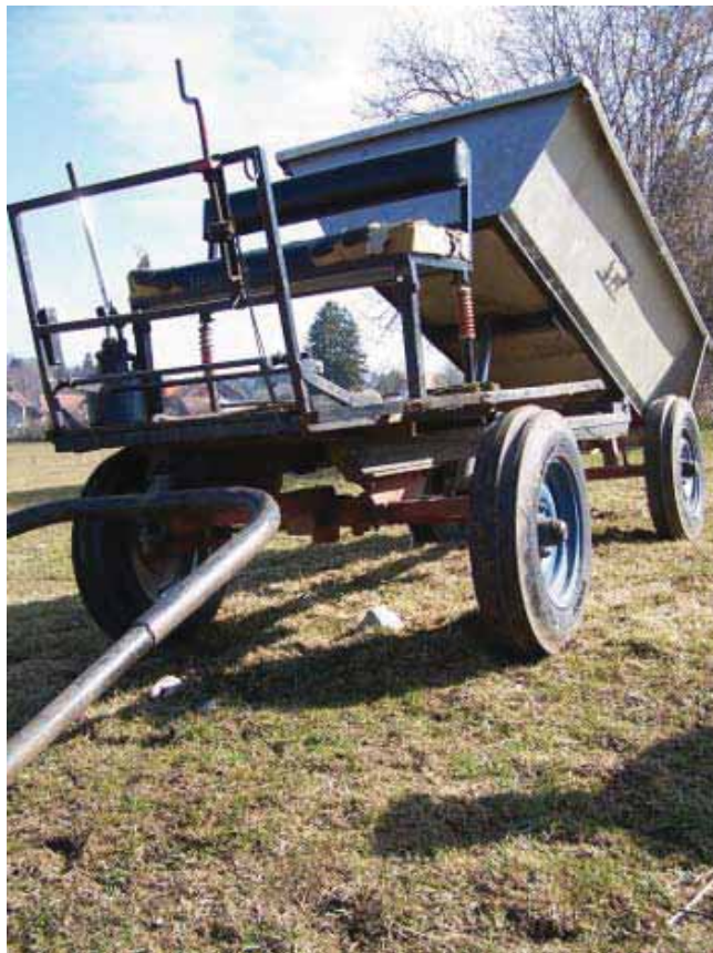
Chariot benne d'Hippotese