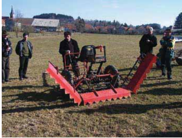
Herse hydraulique pour les carrières.