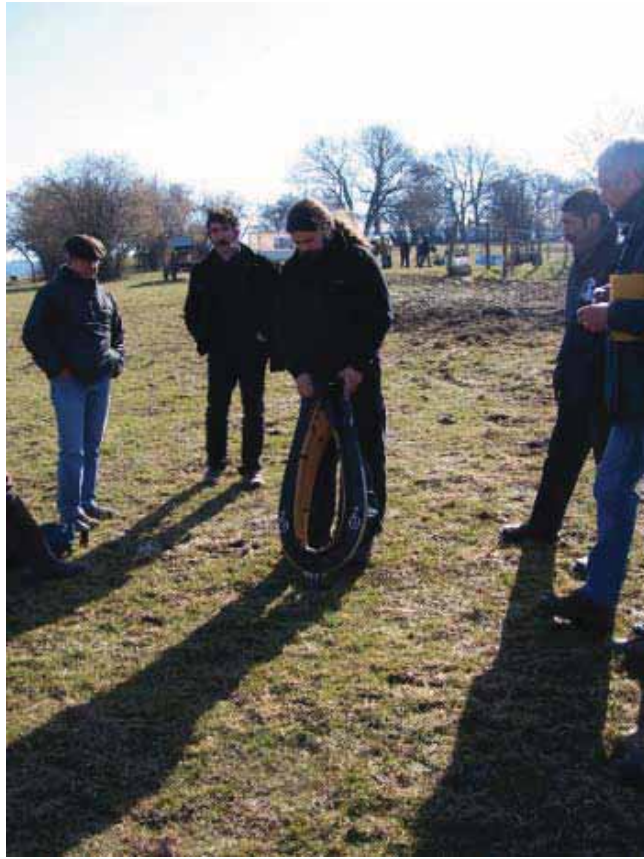
Collier de travail