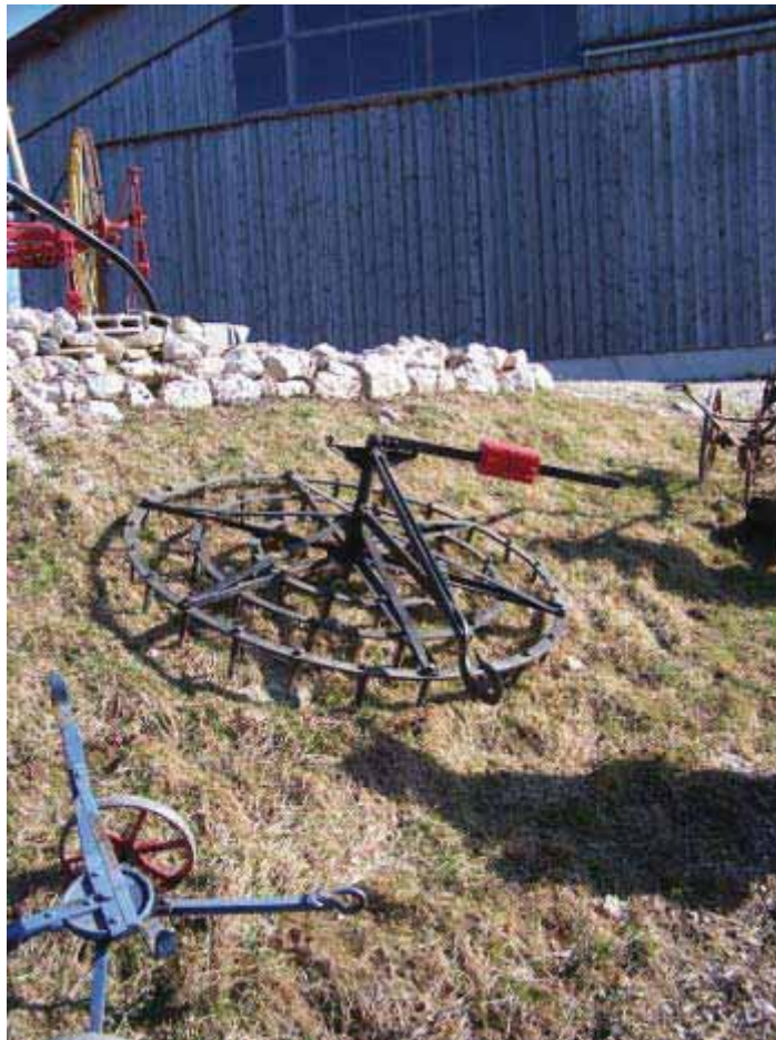
Herse rotative. Suivant la position du poids le sens de rotation est inversé