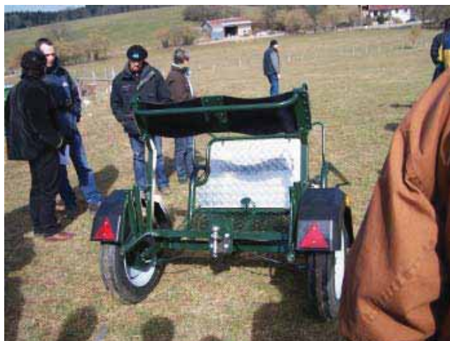
Equitracte, avant-train biplace