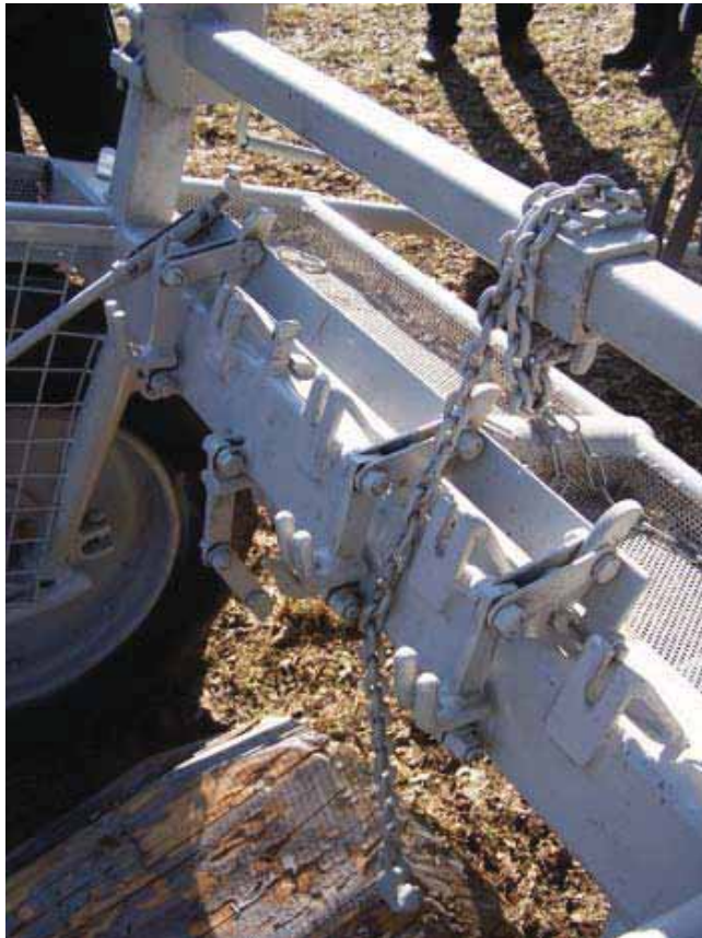
Trains avant de débardage