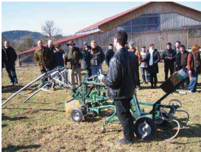
Pégase, machine porte outils pour les vignes